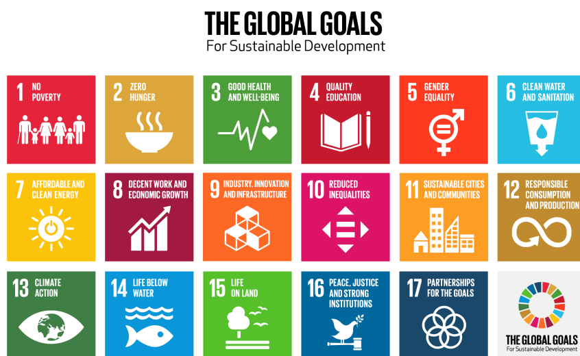
Abbildung 1: Die 17 SDGs (United Nations, o.J.)

Interessensarbeit die politischen Entscheidungsträger überzeugen, dass Bibliotheken wichtige Kooperationspartnerinnen für die Umsetzung der Agenda 2030 sind.