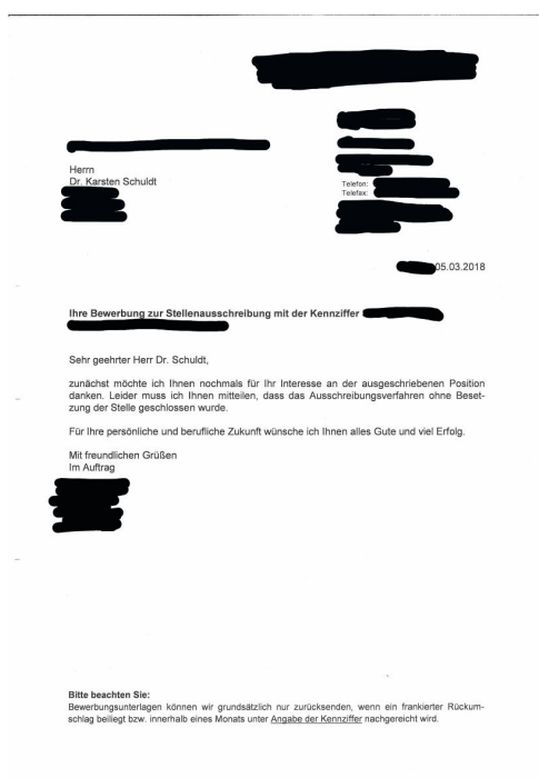
Abbildung 1: Ein Beispiel: Wenn eine Bibliothek eine Stelle intensiv, also am mehreren Stellen, ausschreibt, mehrere qualifizierte Personen zum Bewerbungsgespräch lädt, dann aber entscheidet, die Stelle lieber unbesetzt zu lassen, haben dann vor allem die Bewerberinnen und Bewerber versagt? Oder könnte nicht auch der Bewerbungsprozess fehlerhaft sein? Könnten zum Beispiel die Bewerbungsgespräche gar nicht die realen Kompetenzen der Eingeladenen aufgedeckt haben? Und was, wenn das nicht einmal, sondern relativ oft passiert?